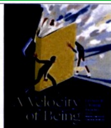
A Velocity of Being, di Maria Popova (Enchanted Lion Books, 2019)