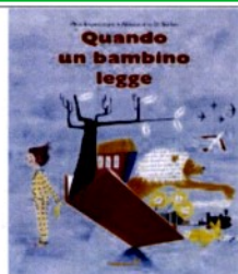
Quando un bambino legge, di Pino Imperatore (Edizioni Primavera, 2018)