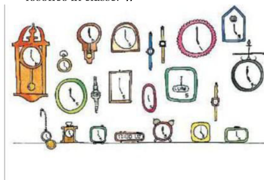
Doninelli. Copertina di «Tre casi per l'investigatore Wickson Alieni»