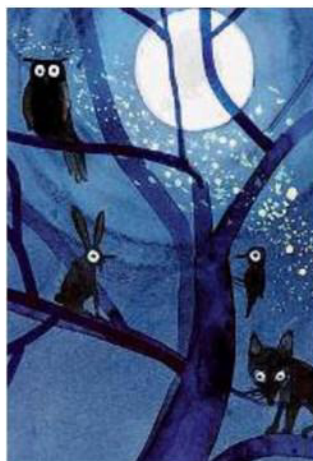
La Zanotti. «Sorpresa nel Bosco»