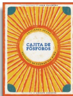
«Cajita de fósforos. Antologia de poemas sin rima» (a cura di Adolfo Cordova) Ediciones Ekaré