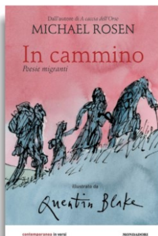
Michael Rosen «In cammino» (trad. di Roberto Piumini) Mondadori pp. 144, €16 - Dai 6 anni