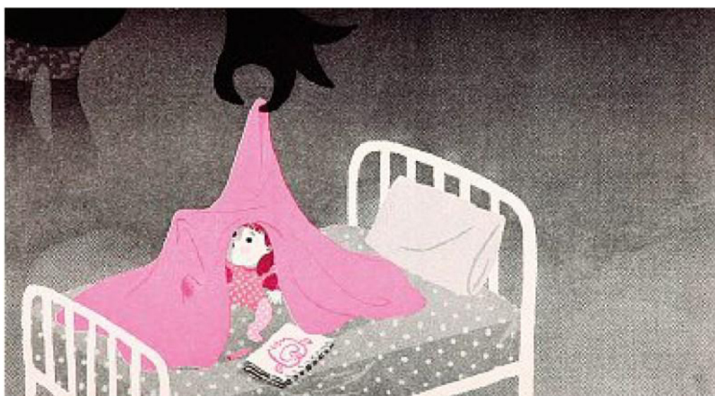
Un'illustrazione dell'artista coreana Hwang Eunah, selezionata per la Mostra degli Illustratori 2018