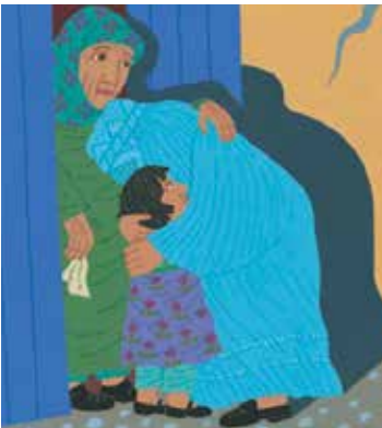
Beatrice Masini, Fabian Negrin, Le amiche che vorresti (e dove trovarle), Giunti Editore, Firenze 2019