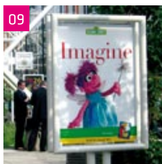
All'interno della Fiera