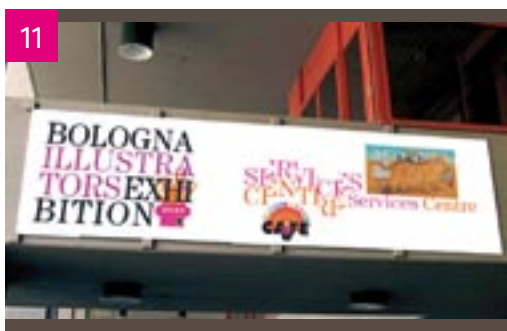
Ingresso principale della Fiera