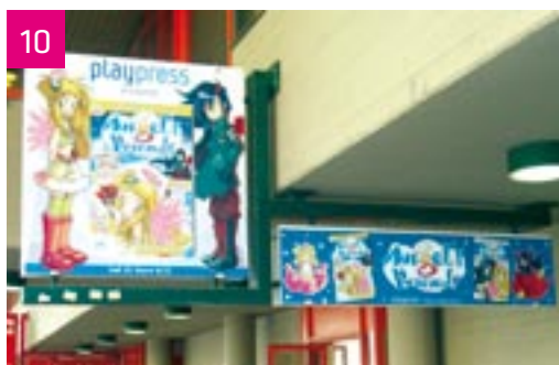
Ingresso principale della Fiera