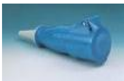
Preso CEE 16/32 A - 220 V