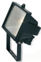
Riflettore mini con lampada alogeno 150W