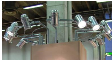
Riflettore "Maxi" con lampada alogeno PAR 1000 W