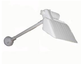
Riflettore con braccio e lampada alogeno 200 W l= 50 cm