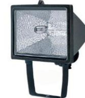
Riflettore "Standard" con lampada alogeno 300 / 500 W