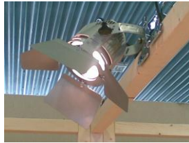
Proiettore BABY 100W