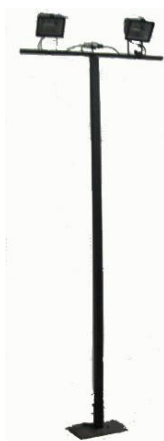
Piantano a "Stelo" h. 2,50 - 3,00 m