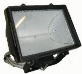
Riflettore "Super" con lampada alogeno lineare 1000 W