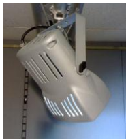
Riflettore "Ioduri" con lampada a scarica 150 W