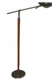
Lampada a bilancere con lampada alogeno 300 W