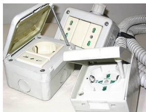
Preso singola universale 10-16 A - 220 V