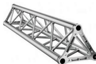
Struttura triangolare Americana TX22 l=1