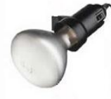
Proiettore Spot 150 W