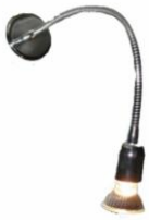
Proiettore dicroica 50W