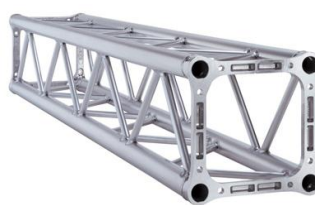
Struttura quadrata Americana QX30 l=1m