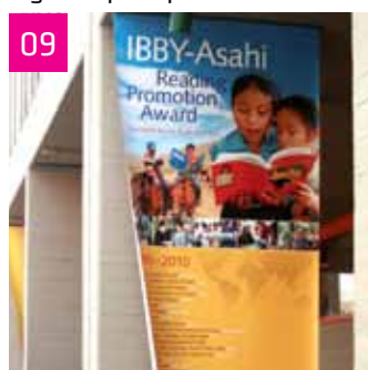
Ingresso principale della Fiera