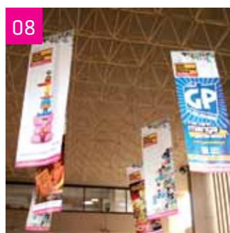
Ingresso principale della Fiera