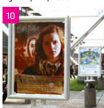
All'interno della Fiera