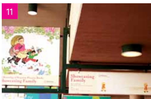
Ingresso principale della Fiera