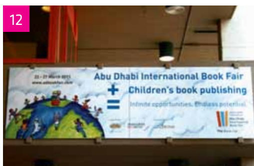
Ingresso principale della Fiera