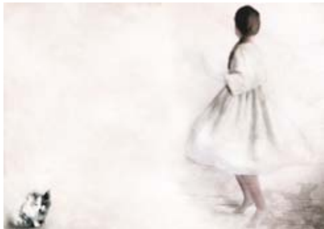
illustrazione di Sonia M.L. Possentini

Avete sempre immaginato gli scrittori con la barba? Gli illustratori con le dita macchiate di colore? Volete conoscere il segreto per prendere 10 nel tema di italiano o nella verifica di disegno? Volete sapere come si inventa un libro illustrato? Volete finalmente poter fare allo scrittore o all'illustratore quella domanda che vi è sempre rimasta incastrata in gola? Vi aspettiamo per svelarvi questi e molti altri segreti all'Happycentro.