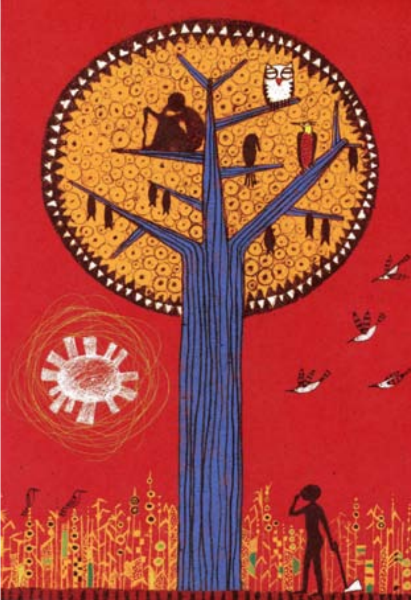
illustrazione di Luciana Justiniani Hees

promosso da Comune di Bologna ■ CEFA ■ Bologna Children's Book Fair ■ in collaborazione con Ibby Italia ■ Biblioteca Salaborsa Ragazzi ■ mostra e catalogo a cura di Giannino Stoppani Cooperativa Culturale ■