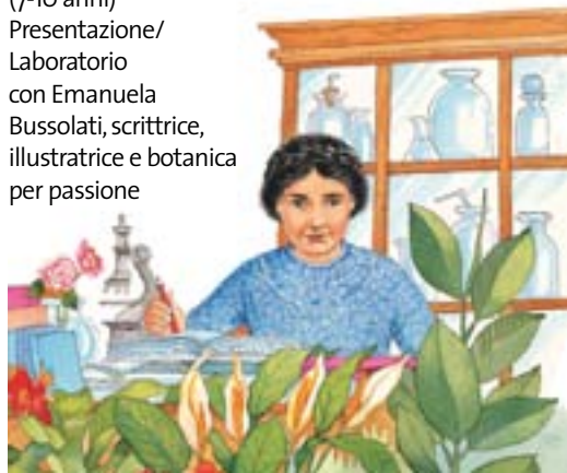
illustrazione di Anna Curti

Giardinieri in erba Editoriale Scienza (7-10 anni) Presentazione/ Laboratorio con Emanuela Bussolati, scrittrice, illustratrice e botanica per passione