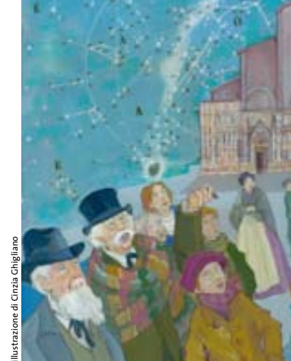
illustrazione di Cinzia Ghigliano

promosso da Comune di Bologna, Istituzione Biblioteche, Salaborsa Ragazzi • Casa Piani, sezione ragazzi della biblioteca Città di Imola • Comune di Cesena Istituzione Biblioteca Malatestiana, Sezione ragazzi "Adamo Bettini" • con il patrocinio di Comitato della Regione Emilia-Romagna per le celebrazioni del 150° anniversario dell'Unità d'Italia • in collaborazione con Cineteca di Bologna • con il contributo di Acantho • Coop Adriatica • Fondazione Cassa di Risparmio in Bologna • mostra itinerante a cura di Antonio Faeti •