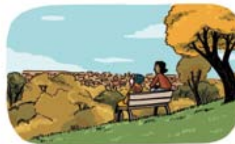
illustrazione di Giulia Sagramola