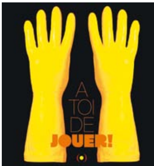
illustrazione di Claire Dé

Pochi colori: giallo e arancio. Qualche oggetto familiare: barattoli, colapasta, recipienti dalle più svariate forme... rigorosamente in plastica! Tutta la fantasia e la voglia di giocare necessari per osservare, combinare, costruire, trasformare, associare titoli ad oggetti d'arte, creare esposizioni e infine banchettare come in tutti i vernissage che si rispettano! Nella sua installazione Claire Dé sollecita i bambini a ritrovare e riconoscere, montare e smontare, inventare, sperimentare, muovendosi tra Dadaismo, Pop-Art, Nouveau Réalisme.