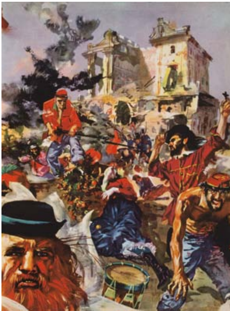
illustrazione di Wolfango Peretti Poggi

051 2194411 ragazzisalaborsa@ comune.bologna.it