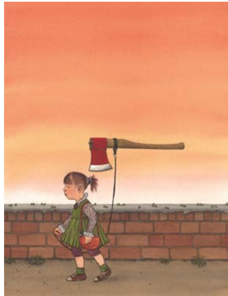
illustrazione di Nikolaus Heidelberg

promosso da Goethe-Institut ■ Bologna Children's Book Fair ■ con il patrocinio di Comune di Bologna ■ in collaborazione con Soprintendenza per i beni librari e documentari della Regione Emilia-Romagna ■ Biblioteca Salaborsa Ragazzi ■ Biblioteca Europea di Roma ■ mostra e catalogo a cura di Hamelin Associazione Culturale ■